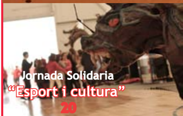
Jornada Solidaria "Esport i cultura" 20